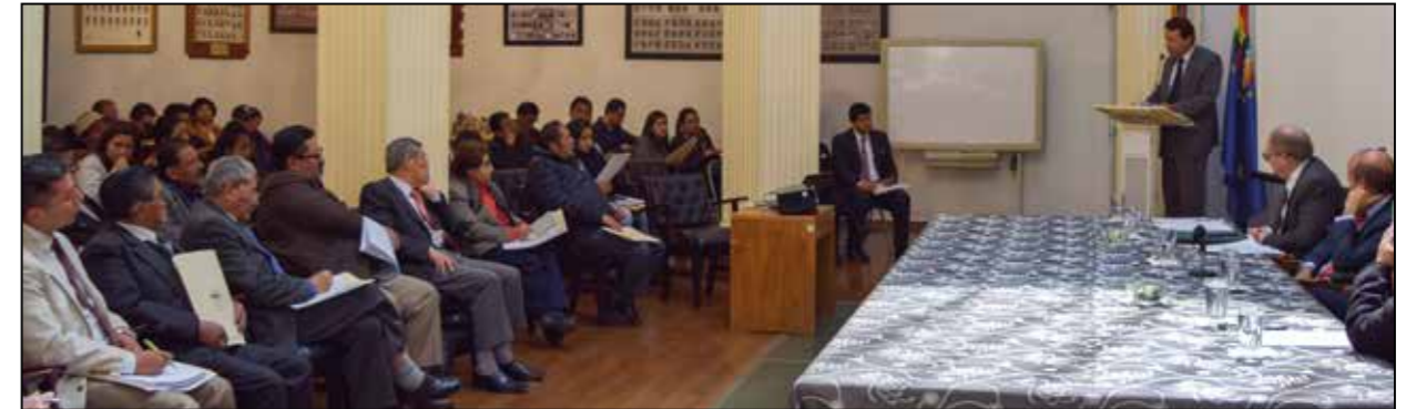
Participantes 2º Foro Interés Ciudadano Libertad de Expresión y Libertad Religiosa 2018