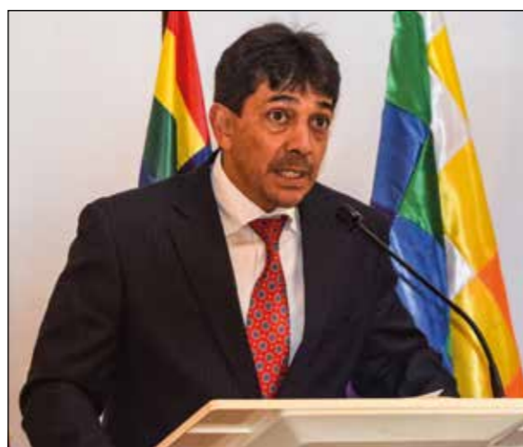
Senador Víctor Hugo Zamora Castedo, Presidente de la Comisión de Política Internacional de la Cámara de Senadores de la Asamblea Legislativa Plurinacional.