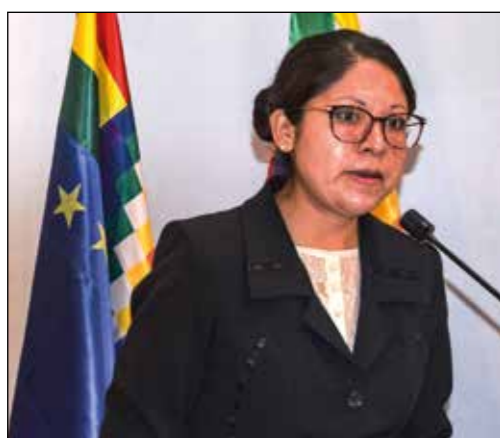
Dra. Marlene Ojeda, Ministerio de Relaciones Exteriores del Estado Plurinacional de Bolivia