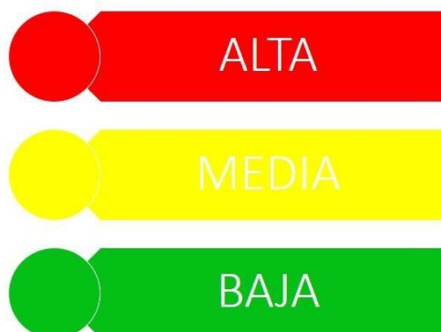
GRÁFICO N° 2: NIVELES DE VULNERABILIDAD O CATEGORÍAS