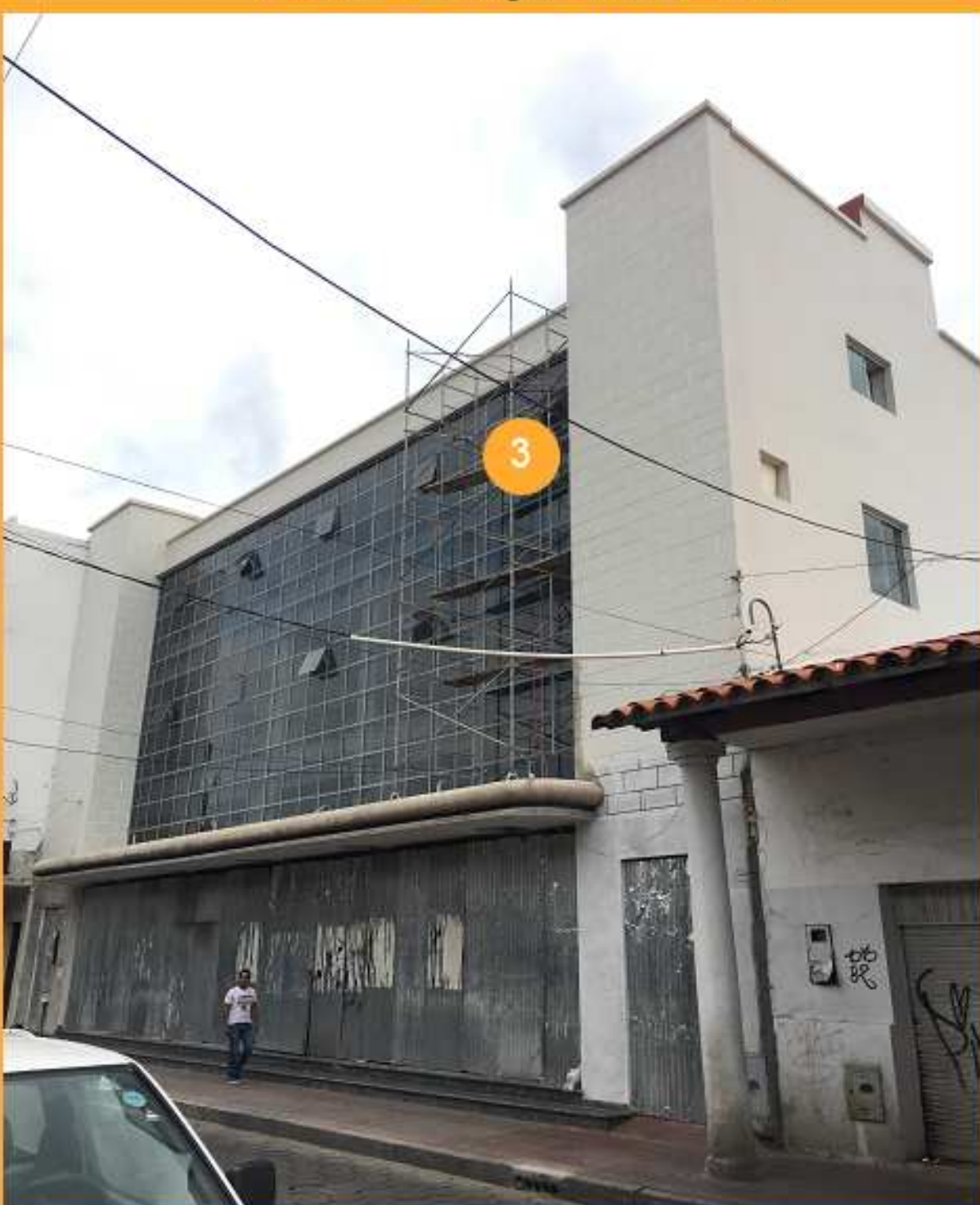
FIG 03: Cine Santa Cruz, 2017 FUENTE: Foto del autor, 2017.