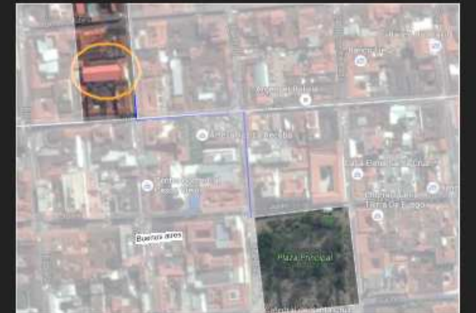
FIG 05: Centro Historico