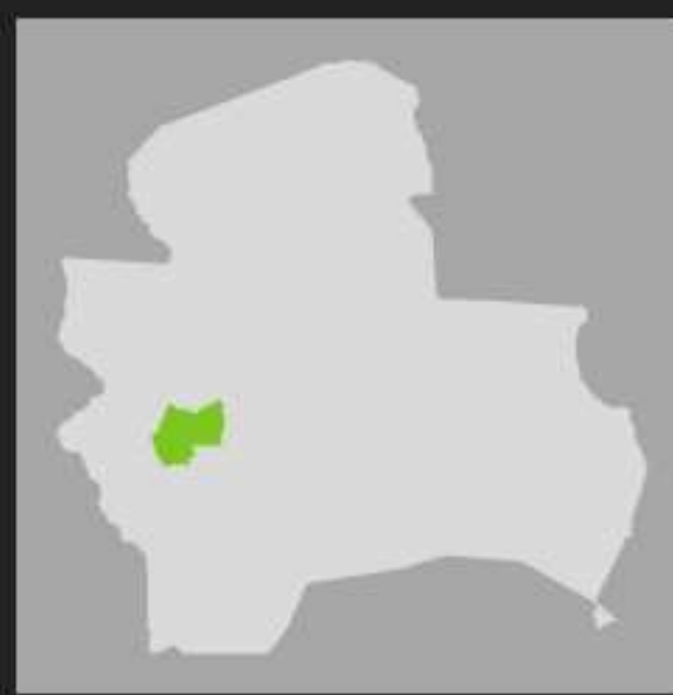
FIG 03: Santa Cruz de la Sierra en relación al Departamento