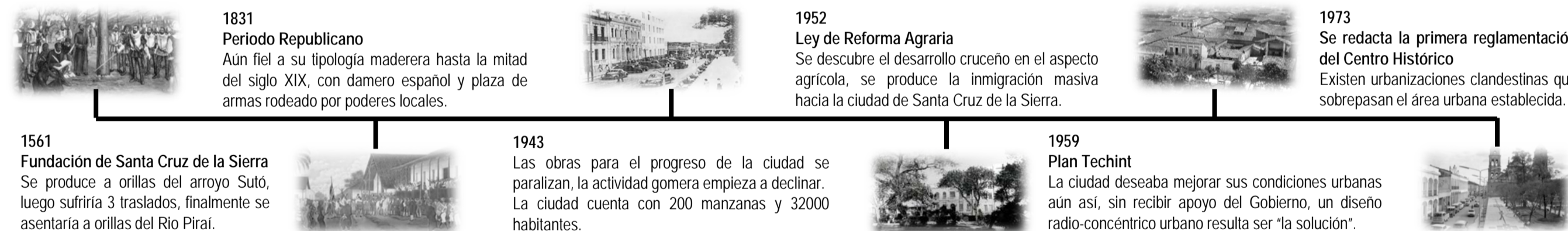
FIGURA 01: Línea de tiempo

El espacio geográfico de la ciudad de Santa Cruz, era conocido como "Las Llanuras del Grigotá" por el pueblo Chané. Durante el siglo XVI, la zona fue conquistada por etnias guaraníes que emigraban desde el sudeste, actualmente tierras del Paraguay y Brasil. La causa de este éxodo, realizado en varios tiempos, se debe a la búsqueda de la legendaria "Tierra Sin Mal".