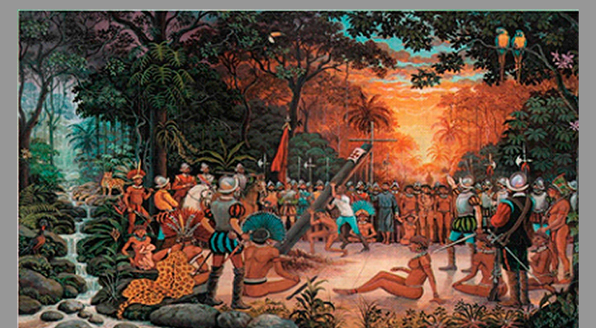
Fig.4: Fundación Santa Cruz la Vieja

El proceso de expedición de los españoles al oriente boliviano, tiene mucha historia ya que hicieron 4 expediciones y en cada una de ellas hay mucho de que hablar. Los viajes que se fueron generando en este proceso de expediciones hasta la fundación de la ciudad, produjeron contactos con los indígenas, exploración del oriente boliviano hasta encontrar el sitio donde se fundaría Santa Cruz la Vieja, así podemos conocer la verdadera historia de la fundación de Santa Cruz la Vieja.