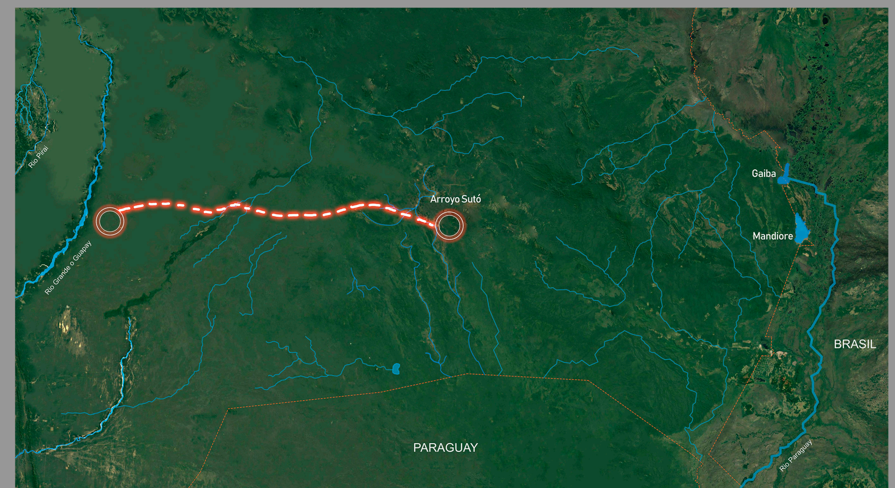
Fig.3: Recorrido La barranca (nueva Asunción) a valle del arroyo Sútó (Santa Cruz de la Sierra)

El 26 de febrero de 1561, en su segundo viaje de expedición, Ñuflo de Chávez fundo la ciudad de Santa Cruz a orillas del arroyo del Sútó, próximo a la actual ciudad de San José de Chiquitos, fue ahí donde se dieron los primeros contactos directos con los indígenas chiquitanos. Hasta 1568 se desempeñó como gobernador la extensa jurisdicción de la gobernación de mojos nominada desde 1571 Santa Cruz de la Sierra, con la misión de “poblar y desencantar la tierra”, la misma que fue cumplir al pie de la letra por la gran familia Ñufleña. (Cirbían, 2006)