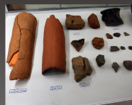
FIG 2: Restos de Cerámica