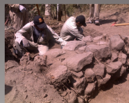
FIG 3: Descubrimiento de cimientos

2003 - Ramón Sanzeteña, menciona la existencia de un sector del templo. Sin embargo, su informe manuscrito es poco detallado, mencionando solamente la existencia de 4 tipos cerámicos recuperados en la excavación, sin presentar cantidades, procedencias estratigráficas, ni fundamentos a su hipótesis de que el lugar que excavó correspondía al templo de la ciudad (Sanzeteña y Tonelli 2003)