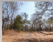
FIG 3: Vista actual del Parque Arqueológico

2004 - 2006 - Partiendo de la base cartográfica realizada por Cortez en 1974, Montenegro en 2003 y posteriormente Chiavazza & Prieto en 2006, procedieron a relevar el terreno mediante los métodos más modernos como Imágenes satelitales y marcaciones GPS, recorriendo metódicamente por las hipotéticas calles y estructuras, corroborando la existencia de la trama urbana, se realizó un relevamiento del sector actualmente conocido como la "Tejería" y su área colindante correspondiente al curso del arroyo Sutú.