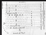
FIG 1: Croquis de Santa Cruz la Vieja

1974 - Eduardo Cortez lleva a cabo un relevamiento de los túmulos y a un corte estratigráfico que señala dos eventos de quema en la base y cumbre de un montículo, lo que constituye el primer antecedente que hasta ahora conocemos de la arqueología histórica boliviana. Allí el autor propuso una metodología de intervención basada en la numeración de las calles. Por lo que se puede apreciar en su croquis, plantea la distribución de 40 manzanas en torno a una plaza central (Chiavazza & Prieto, 2006)