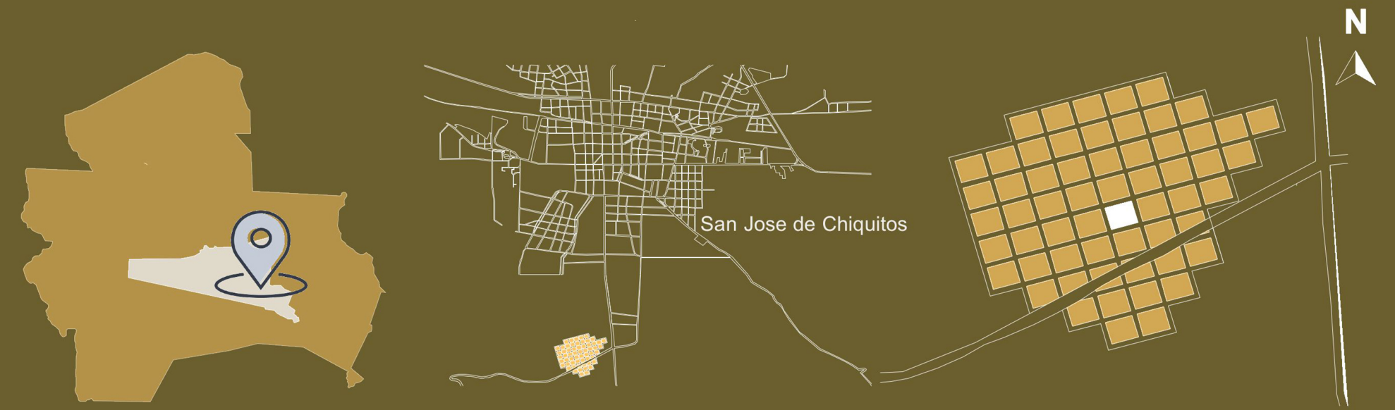
MAPA 1: Santa Cruz de la Sierra- San Jose de Chiquitos-Santa Cruz La Vieja

El “Parque Nacional Histórico Santa Cruz La Vieja” se encuentra ubicado a 3km al Sur de la población de San José, capital de la provincia Chiquitos y a 266 km de la ciudad de Santa Cruz de la Sierra, cuenta con 17080 hectáreas. En el área intersectan los bosques: el Cerrado, Chiquitano y Chaco.